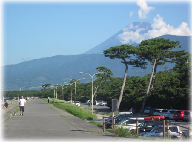
千本浜公園 防潮堤から望む富士

総延長 506 k mの海岸線を持つ静岡県には、世界ジオパークに認定された伊豆半島、駿河湾超しの富士山を望む三保の松原等の世界遺産群、そして浜名湖など、変化に富んだ海岸景観と優れた自然環境が残されています。